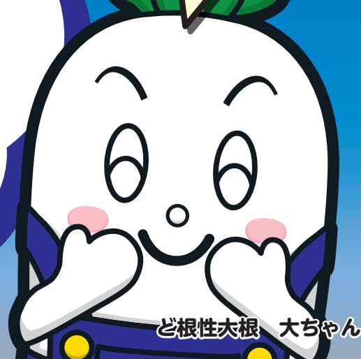
ど根性大根 大ちゃん

相生市では、新型コロナウイルス感染症拡大の長期化による地域経済の落ち込みに対し、消費喚起を図り地域を活性化するとともに、物価高騰に伴う市民の生活支援を目的として、12月・1月に使用できる「相生市生活応援商品券事業」を昨年に引き続き第2弾として実施します。